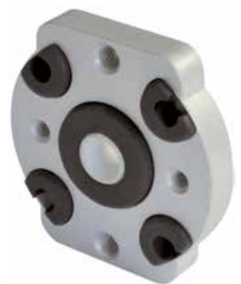
Uložení na druhé straně: základová deska, tlumení a objímka hřídele