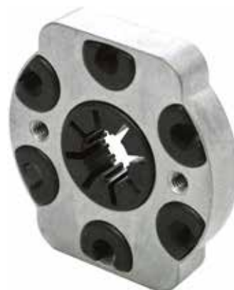
Uložení motoru: základová deska a tlumení

Motor může mít otáčky v rozsahu 16 - 134 ot./min.