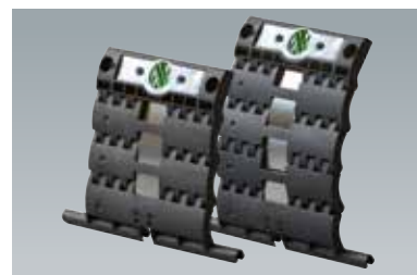
Disponibile con 2 o 3 elementi per profili mini e maxi