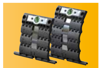
Lieferbar in 2- und 3-gliedriger Ausführung für Mini- und Maxi-Profile.