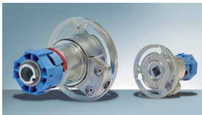
Engranaje cónico universal