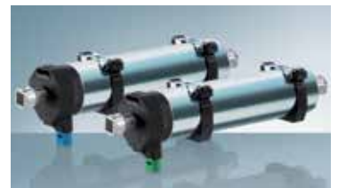
GJ56.. E06 und E07 SMI

Auch im Bereich Jalousieantriebe gibt es eine Menge Neues: Mit den Premium-Elektronikantrieben E06 und E07 bauen wir unsere umfangreiche GEIGER-Produktserie GJ56.. weiter aus. Die ergänzten Funktionen versprechen mehr Sicherheit bei der Bedienung sowie einen größeren Einsatzbereich im Kontext der voranschreitenden Gebäudeautomation durch eine integrierte SMI- oder KNX-Schnittstelle.