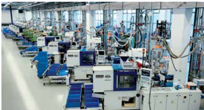
100% GEIGER: Blick in die Kunststofftechnik

Seit seiner Gründung produziert GEIGER ausschließlich am Standort Bietigheim-Bissingen. Alle Bereiche des Unternehmens sind räumlich wie auch verfahrenstechnisch eng miteinander verknüpft. Die hohe Integration