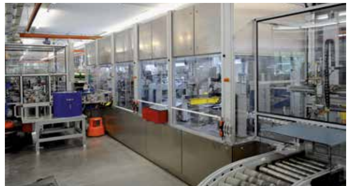
Lärm minimieren und seine Ausbreitung durch Schallschutzhauben verhindern: vollständig gekapselte Montageanlage.

Und dennoch: Trotz all dieser Maßnahmen bleibt das Tragen des Gehörschutzes in der Produktion Pflicht! Nur so kann eine Gefährdung des Gehörs zuverlässig beseitigt – zumindest aber auf ein Minimum verringert werden.