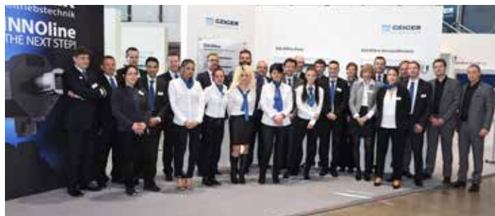
Più di 30 membri del personale hanno fornito supporto alla clientela.

La R+T Turchia si svolgerà a novembre 2015. Anche qui la GEIGER sarà presente coi suoi prodotti.