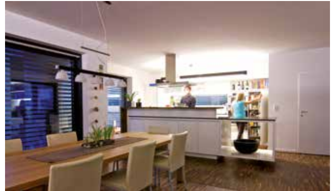
Accendete la vostra luce: intensa quando si cucina e soffusa quando si guarda un film. Nascoste dietro cornici ornamentali, le strisce LED garantiscono un'atmosfera perfetta.

protezioni solari di Robert W. “Al mattino, vengono oscurate le finestre verso est, mentre nel pomeriggio quelle verso ovest. La famiglia e le piante hanno sempre la luce necessaria!”