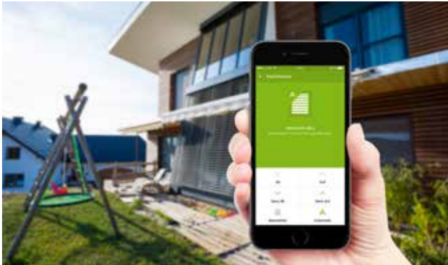
Controlla la tua Smart Home da qualsiasi luogo: tramite PC, tablet o smartphone, con applicazione gratuita.

“Cominciamo dal montaggio. È stato un lavoro pulito! Tutto è radiocomandato: non c'è bisogno di posare cavi fino agli interruttori. E, con la tecnologia mesh, i molti muri di cemento in casa mia non sono un problema per i segnali radio.”