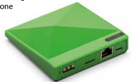
Il Miniserver Go della Loxone è il cuore della Smart Home.