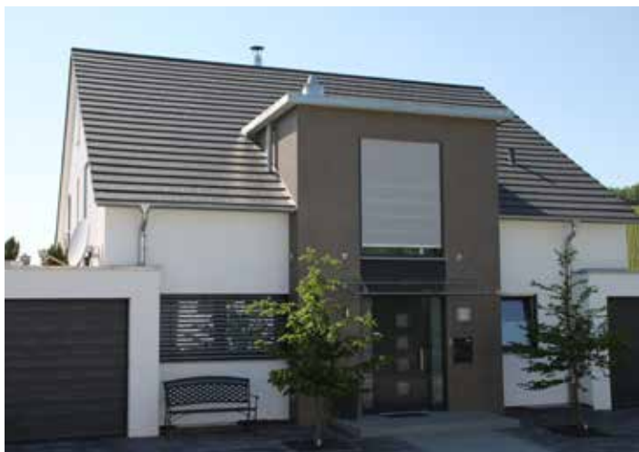
Protezione solare automatica: determinazione delle coordinate di longitudine/latitudine, dell'orientamento delle finestre e integrazione di dati meteo aggiuntivi.

Attraverso le coordinate GPS ed utilizzando il servizio meteo, il Miniserver controlla automaticamente le