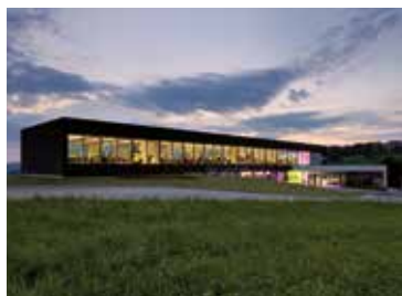
Stabilimento Loxone a Kollerschlag, in Alta Austria.

Ö: Le protezioni solari nelle case private saranno collegate con illuminazione, riscaldamento, allarme e molto di più – comandati ed automatizzati con la massima precisione attraverso una soluzione centralizzata. Questo è ciò che già sperimentiamo col sistema Smart Home della Loxone. Insieme alla GEIGER, noi esanderemo ulteriormente il nostro ruolo pionieristico nel comando e nell'automazione delle protezioni solari.