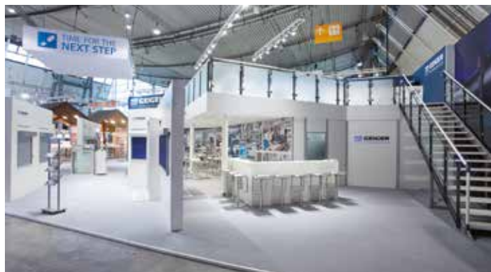
Il nuovo design dello stand ha attirato una notevole attenzione.